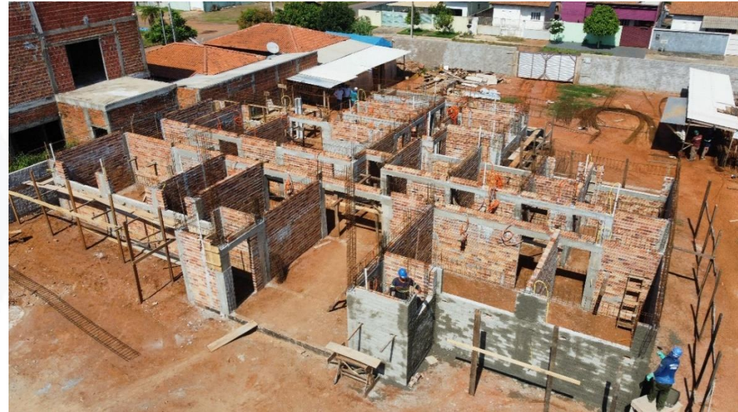
CONST. UPA - SEC. DE SAÚDE CONTRATANTE: PREFEITURA MUNICIPAL DE SAPEZAL