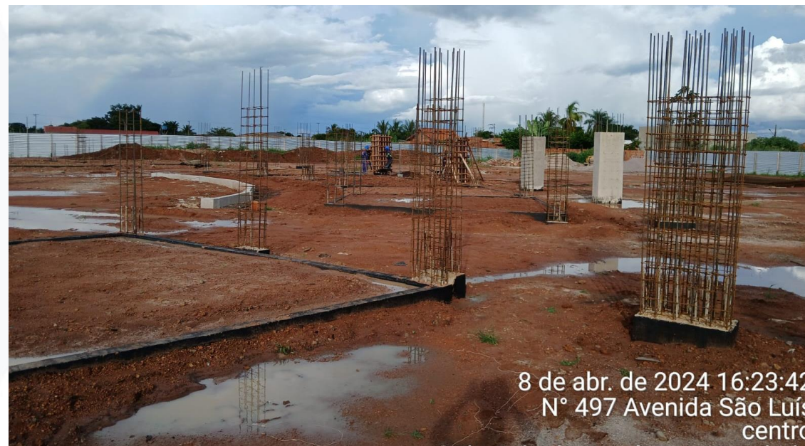
CONSTRUÇÃO CONGÓDROMO CONTRATANTE: PREFEITURA MUNICIPAL DE VILA BELA

8 de abr. de 2024 16:23:42 N° 497 Avenida São Luís centro