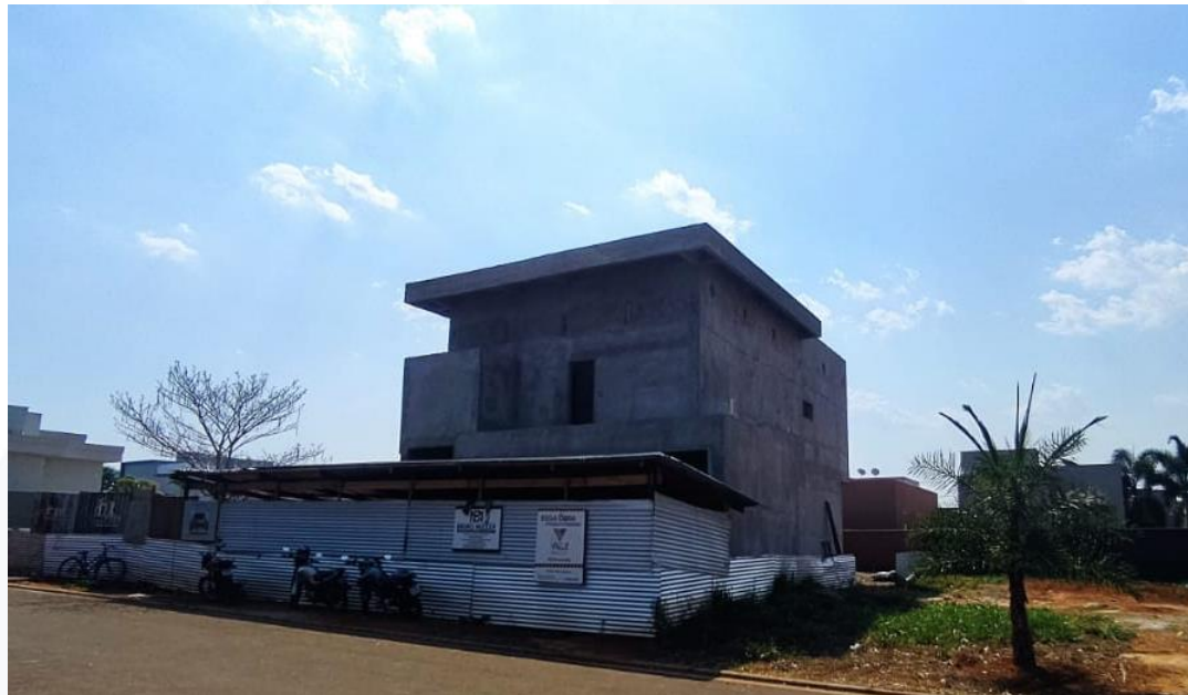
CONSTRUÇÃO RESIDENCIAL CONTRATANTE: EVELYN