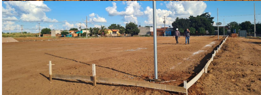
CONTRUÇÃO DAS QUADRAS E CAMPO DE FUTEBOL } CONTRATANTE: PREFEITURA MUNICIPAL DE SAPEZAL