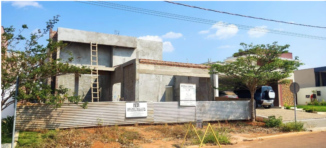
CONSTRUÇÃO RESIDÊNCIA IGOR