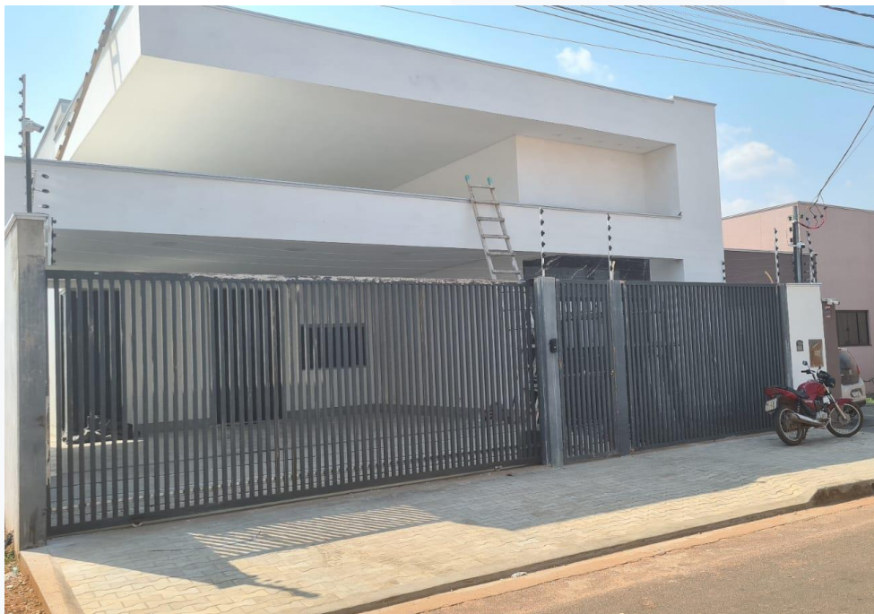
CONSTRUÇÃO RESIDÊNCIAL CONTRATANTE: GILSON