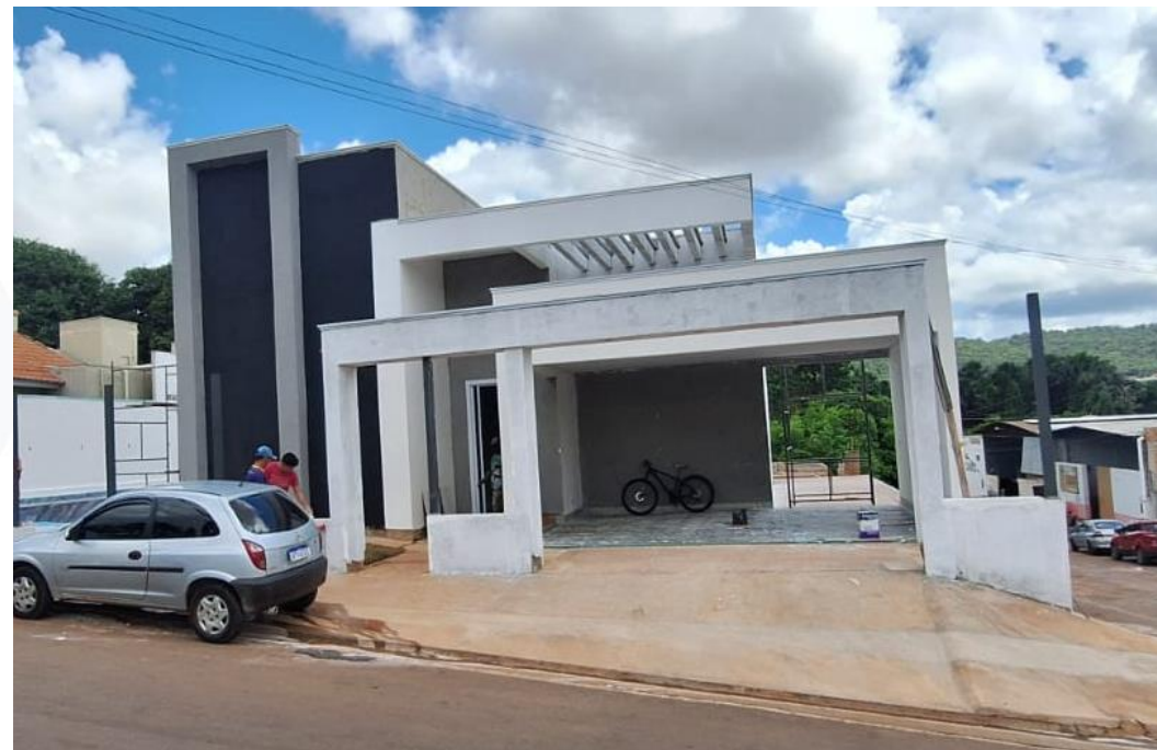
CONSTRUÇÃO RESIDÊNCIAL CONTRATANTE: DINAMÉRICO