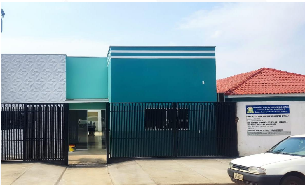
REFORMA ESC. M. ALCIDES F. ROCHA CONTRATANTE: PREFEITURA MUNICIPAL DE PONTES E LACERDA