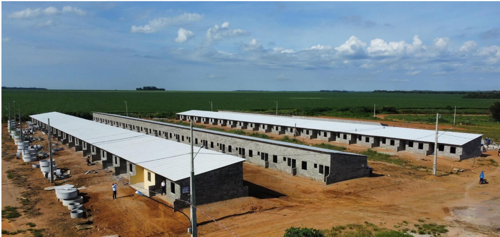
CONST. CASAS POPULARES - SEC. DE A. SOCIAL CONTRATANTE: PREFEITURA MUNICIPAL DE SAPEZAL

FICHA TÉCNICA: Obras Públicas: 03 | Obras Privadas: 00