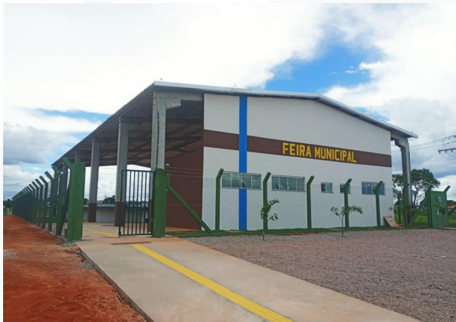
CONSTRUÇÃO FEIRA MUNICIPAL CONTRATANTE: PREFEITURA MUNICIPAL DE VILA BELA

FICHA TÉCNICA: Obras Públicas: 03 | Obras Privadas: 01