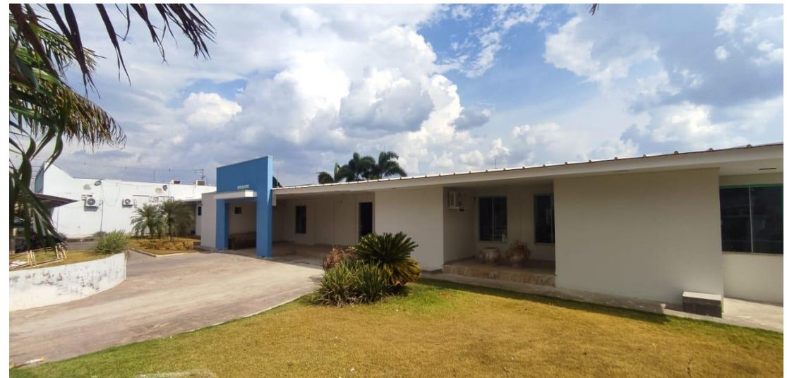
REFORMA HOSPITAL SANTA CASA CONTRATANTE: PREFEITURA MUNICIPAL DE PONTES E LACERDA