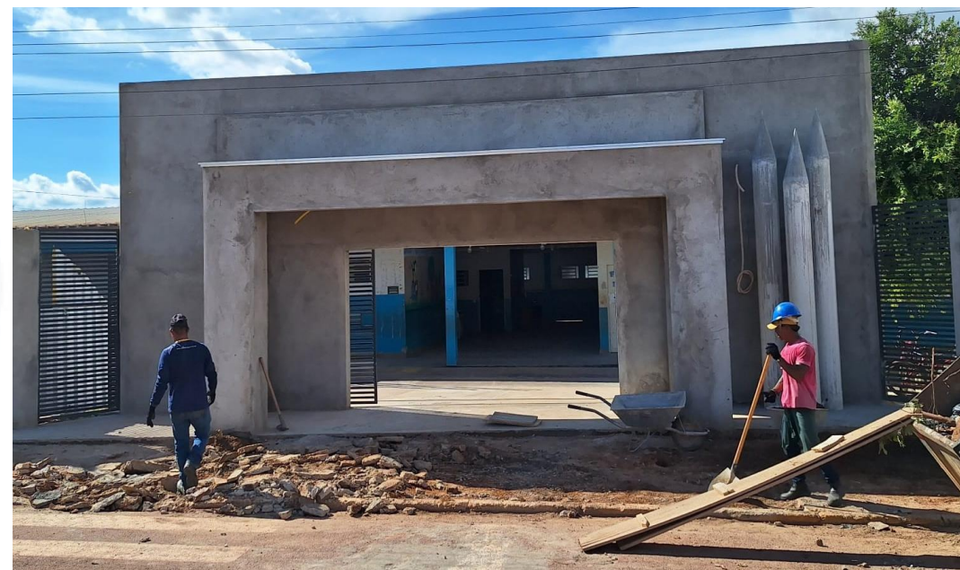
REFORMA ESC. M. ANTONIO C. BRITO CONTRATANTE: PREFEITURA MUNICIPAL DE PONTES E LACERDA