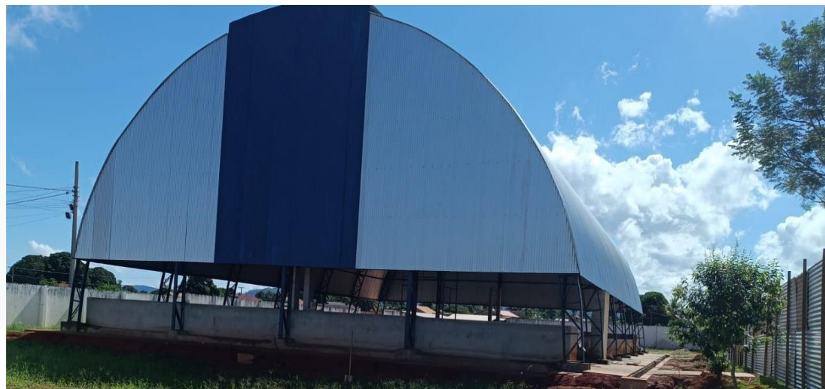
CONST. QUADRA POLIESPORTIVA - SEC. DE ESPORTE CONTRATANTE: PREFEITURA MUNICIPAL DE NOVA LACERDA