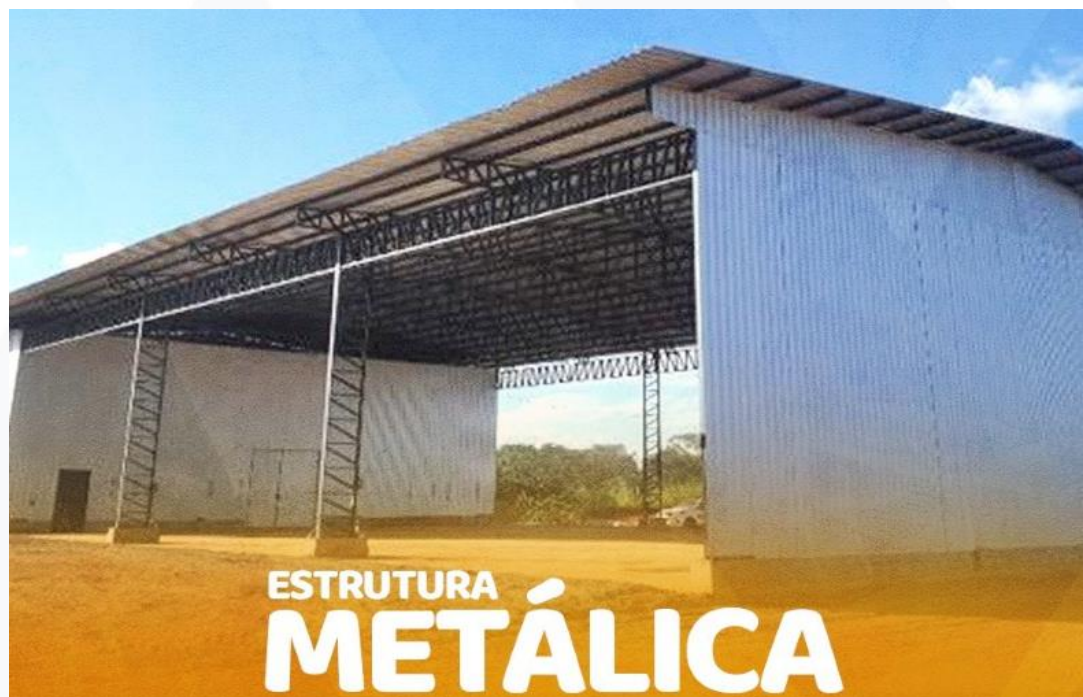
CONSTRUÇÃO OFICINA MECANICA CONTRATANTE: MINERAÇÃO APOENA