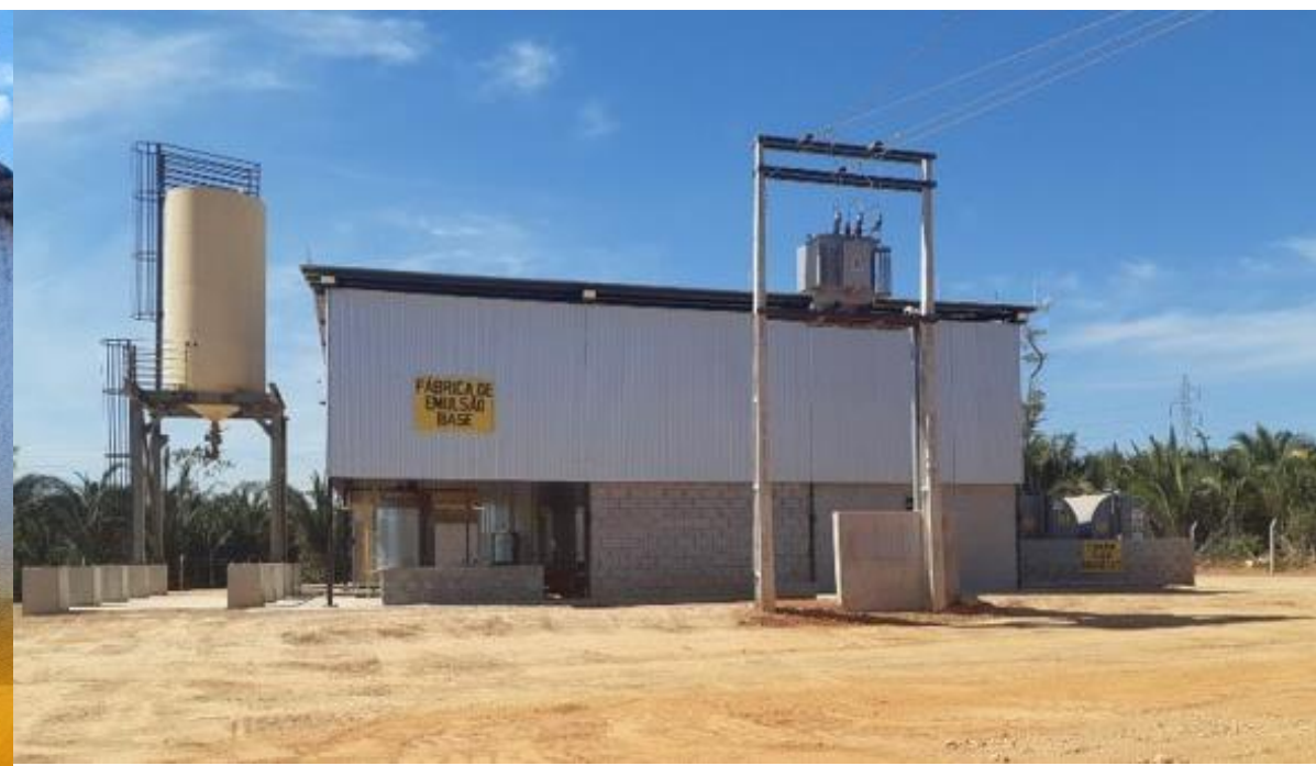
CONSTRUÇÃO FABRICA DE EMULSÃO BASE PARA EXPLOSIVOS CONTRATANTE: MINERAÇÃO APOENA