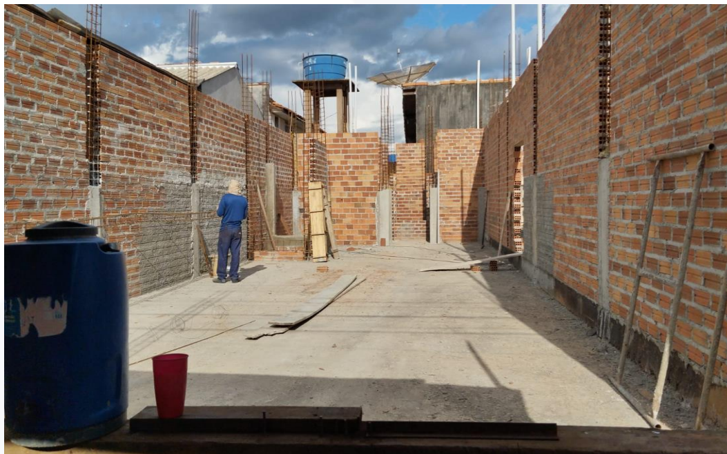
CONSTRUÇÃO DE SALAS COMERCIAIS 390M 2 CONTRATANTE: LEONARDO