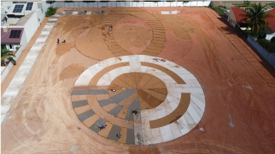
CONSTRUÇÃO PRAÇA DO CAQUI CONTRATANTE: PREFEITURA MUNICIPAL DE CAMPO NOVO DOS PARECIS

FICHA TÉCNICA: Obras Públicas: 02 | Obras Privadas: 00