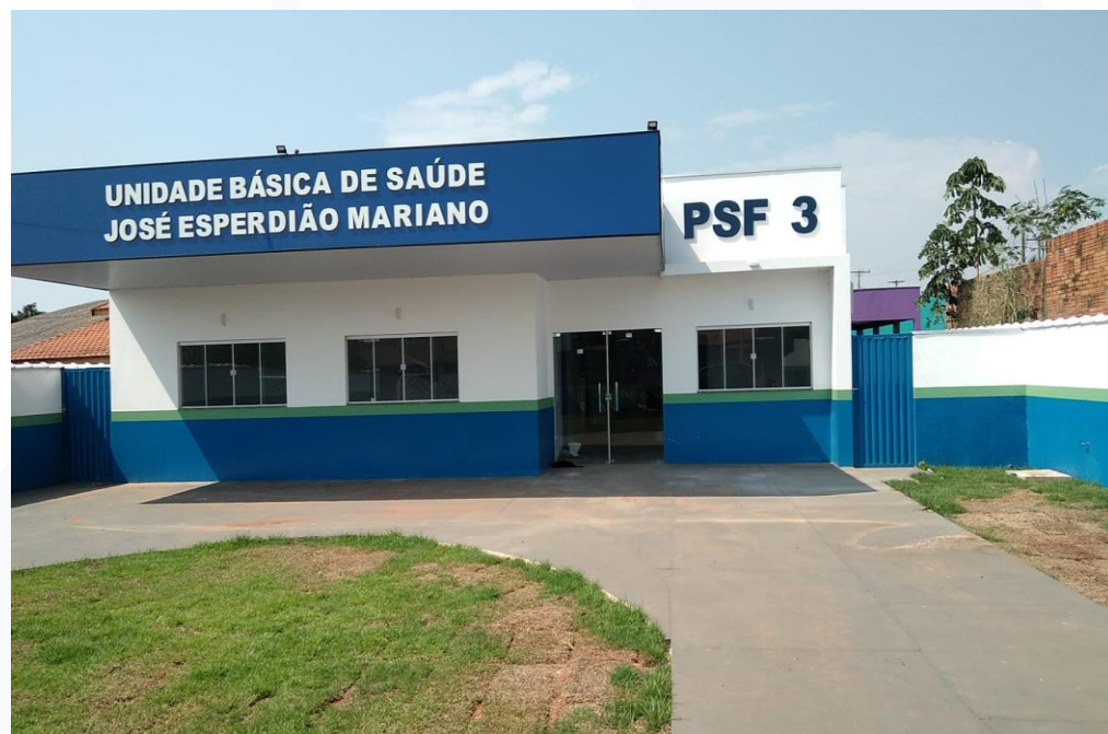
REF. PSF - SEC. DE SAÚDE CONTRATANTE: PREFEITURA MUNICIPAL DE NOVA LACERDA

FICHA TÉCNICA: Obras Públicas: 04 | Obras Privadas: 00