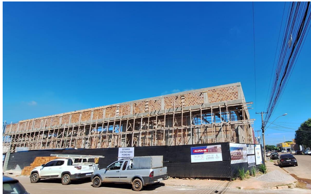
CONTRUÇÃO DE SALAS COMERCIAIS 600M 2 CONTRATANTE: LEONARDO