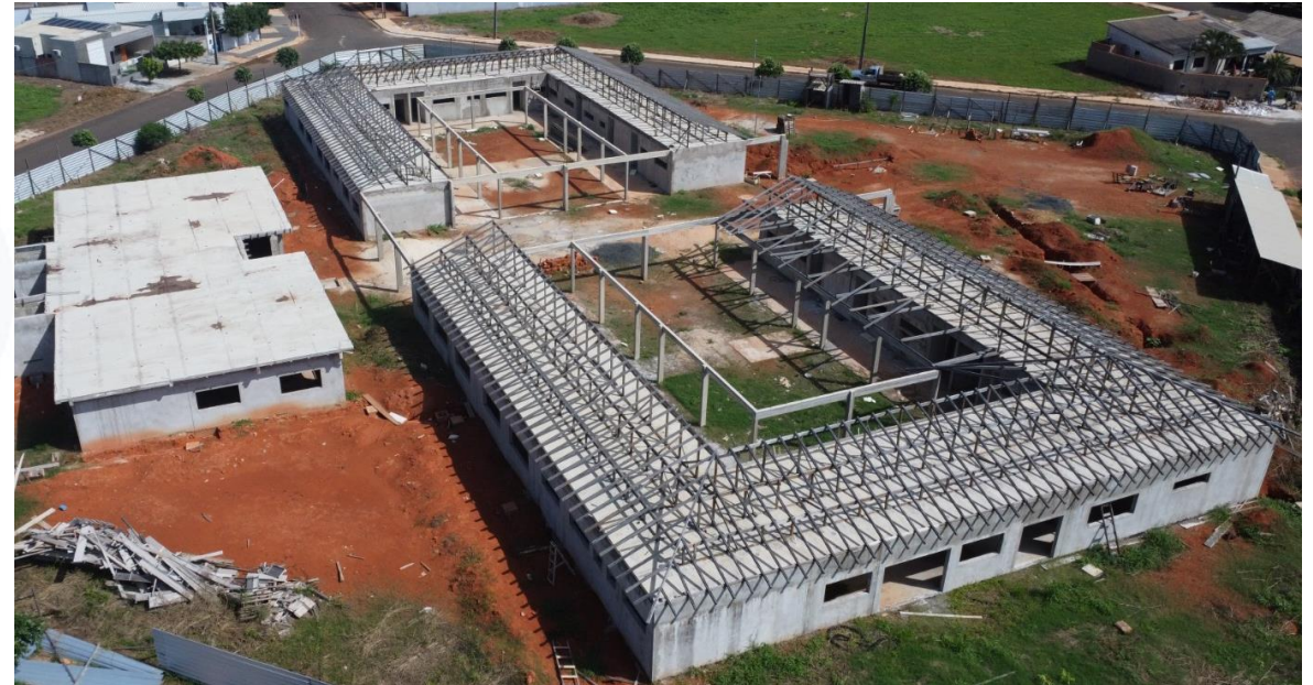
COBERTURA CRECHE OLENKA CONTRATANTE: PREFEITURA MUNICIPAL DE CAMPO NOVO DOS PARECIS