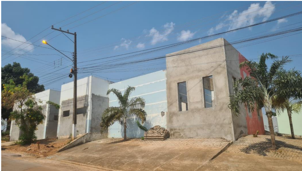
UPA - UNIDADE DE PRONTO ATENDIMENTO CONTRATANTE: PREFEITURA MUNICIPAL DE PONTES E LACERDA

FICHA TÉCNICA: Obras Públicas: 03 | Obras Privadas: 12